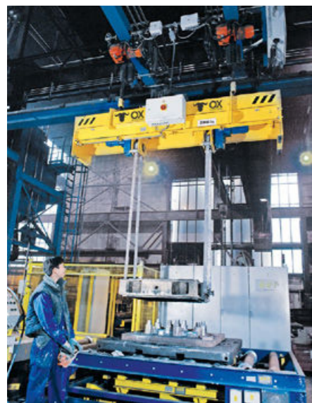
Capacidad: 2t Distancia de la correa: 900 – 2,000mm Ajuste: eléctrico