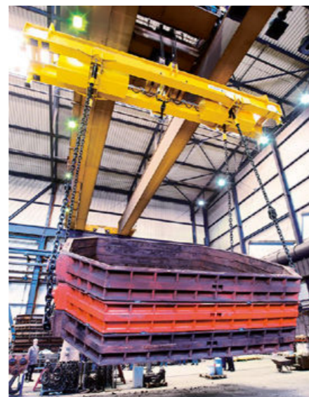
Capacidad: 125 t Distancia de la correa: 3,050 – 8,800mm Ajuste: eléctrico