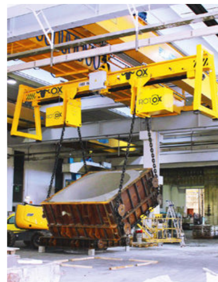
Capacidad: 30t Distancia de la correa: 1,200 – 5,500mm Ajuste: eléctrico