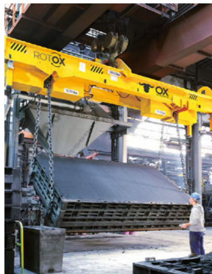
Capacidad: 100t Distancia de la correa: 2,900 – 7,000 mm Ajuste: eléctrico