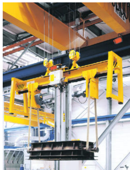
Capacidad: 12 t Distancia de la correa: 1,700 – 5,000 mm Ajuste: eléctrico